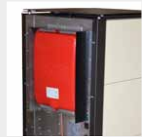
VASO D'ESPANSIONE INTEGRATO INTEGRATED EXPANSION VESSEL VASE À EXPANSION INTÉGRÉ