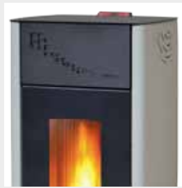
RIVESTIMENTO ACCIAIO VERNICIATO PAINTED STEEL LINING REVÊTEMENT EN ACIER PEINT