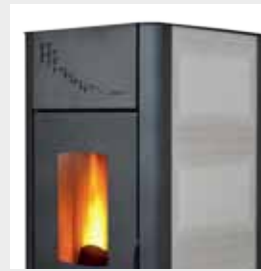
RIVESTIMENTO IN CERAMICA CERAMIC LINING REVÊTEMENT EN CÉRAMIQUE