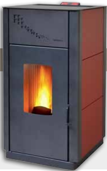
RIVESTIMENTO FINITURA "MINERAL" PANELS LINING FINISHES "MINERAL" REVÊTEMENT EN FINITION «MINERAL»